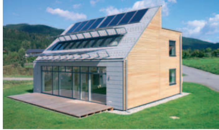
Wärmepumpe und Solaranlage in einem Gerät: Alfred Vorderegger und Sonnenkraft machen Ihr Haus umweltfit.